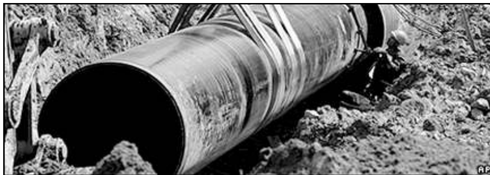
Gas and oil revenues helped lift the economy out of crisis

Комментарии и оценки по политическим и социальным вопросам оперируют клише дискурса либерализма: транзиция – transition , госконтроль – state control и т.д.