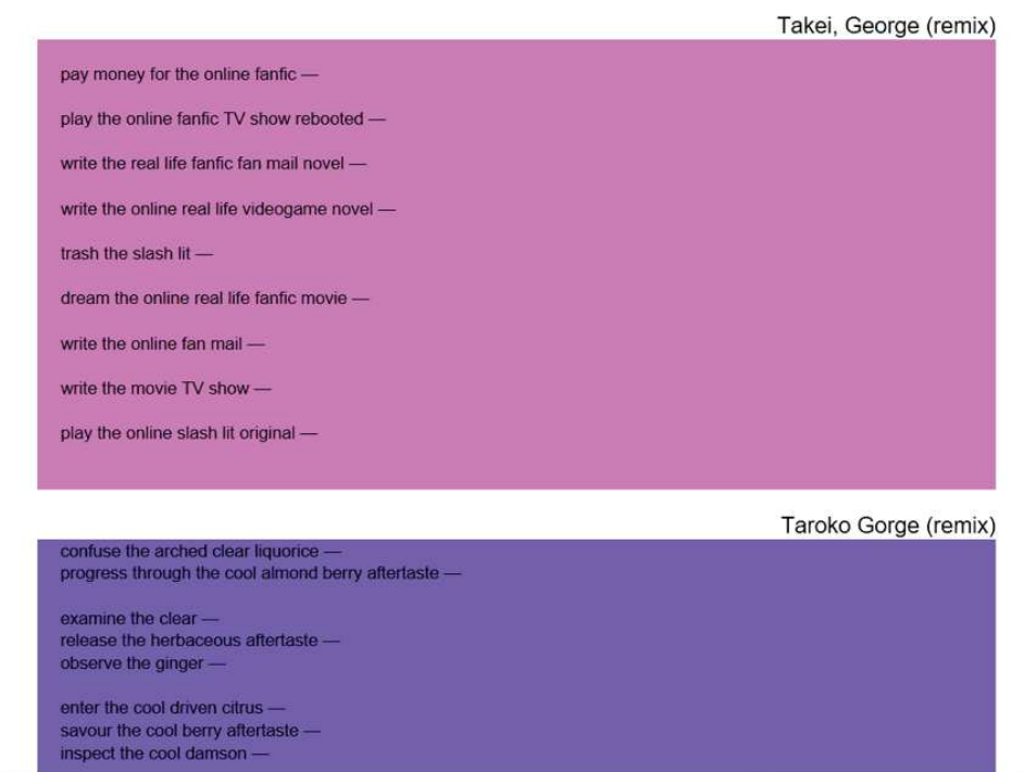
Рис. 3. Фрагмент электронного художественного текста «Argot Ogre, OK!» [Plotkin, 2016, URL]

для интерлиньяжа восходит к слову lead , что значит свинцовая шпона. Свинец в период ручного набора использовался для литья букв, а чтобы увеличить расстояние между строками туда подкладывали полоску свинца ( lead ). Большинство компьютерных программ используют термин line spacing (пробел между строками) [Феличи, 2004, с. 175 – 176]). Данный прием используется, как правило, в электронных художественных текстах не самостоятельно, а в совокупности с другими приемами графического выделения текстовых сегментов. Например, в произведении Э. Плоткина «Argot Ogre, OK!» [Plotkin, 2016, URL] варьирование межстрочного пробела (интерлиньяж) представлено в совокупности с дефисацией. На одной вкладке строки поэтического произведения в верхней части (алый фон) отделены дефисом и межстрочным пробелом (текст с интерлиньяжем), а в нижней части (синий фон) дефисация сопряжена с отсутствием межстрочного пространства (текст без интерлиньяжа). Интерлиньяж оказывает существенное влияние на визуальное восприятие текста, облегчая или затрудняя его прочтение (рис. 3).