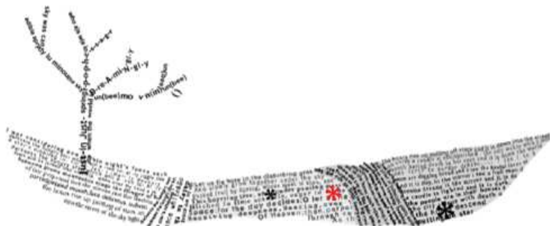
Рис. 1. Фрагмент электронного художественного текста «The Sweet Old Etcetera» [Cliford, 2011, URL]

2. Кернинг (Кернинг (англ. kerning ) при наборе текста — избирательное изменение интервала между буквами в зависимости от их формы [Справочник издателя..., 2003]). Увеличение интервала между буквами в электронном художественном тексте является весьма распространенным приемом, однако в отличие от своей первоначальной функции, характерной для печатного текста (визуальное выравнивание межбуквенных просветов, которое преимущественно используется в заголовках), в электронном произведении данный прием большей частью гиперболизирован, а его чисто практическая функция несет определенную идейно-тематическую нагрузку. Так, например, в произведении З. Файджфера «Ars Poetica» [Fajfer, 2016, URL] постепенно увеличивающаяся разрядка приводит к последовательному разрушению (с визуальной точки зрения) текста, фразы и в конечном итоге слова (рис. 2).