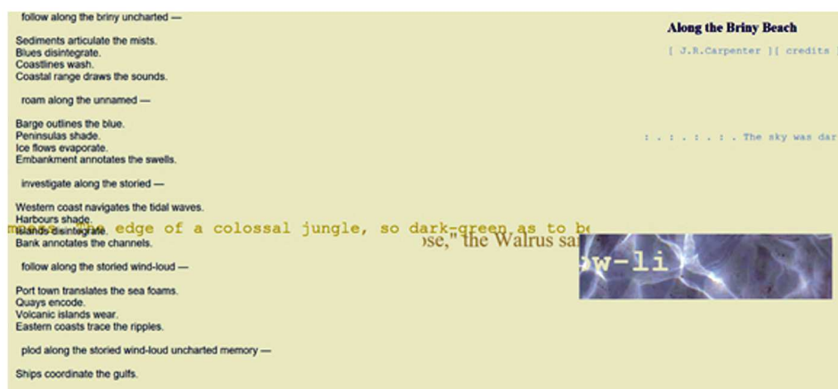
Рис. 4. Фрагмент электронного художественного текста «Along the Briny Beach»[Carpenter, 2016, URL]

penner, 2016, URL] поэтический текст, задаваемый текстовым генератором, появляется в левой части экрана в виде постоянно меняющегося порядка строк и их комбинаций на экране. Фоновые тексты (цитируемые Фоновые тексты представлены прямыми цитатами из произведений Э. Бишоп «The End of March», Л. Кэрролла «The Walrus and The Carpenter», Дж. Конрада «Heart of Darkness», Ч. Дарвина «The Voyage Of The Beagle») появляются на экране сразу в трех форматах изображения (три передвигающиеся линии текста справа, выделенные соответственно синим, песочным/охра и желтым) (рис. 4).