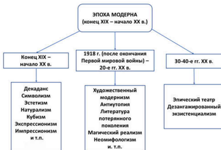
Рис. 1. Структура эпохи модерна в её основных явлениях

Познакомившись с историей зарубежной литературы рубежа XIX – XX вв. и первой половины XX столетия, студенты сформировали представление о модерне и о художественном модернизме. 1 Поэтому, начиная разговор о новом литературном периоде, следует актуализировать опорные знания учащихся и вспомнить специфику предшествующей эпохи, этапы её развития, основные художественные эксперименты. Одним из сопутствующих заданий может быть составление схемы, в которой рекомендуется системно отразить смену периодов модерна, основанных на культурных и исторических событиях. Примерный образец полученной схемы можно представить в виде рис. 1.